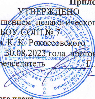
Таблица-сетка часов учебного плана муниципального бюджетного общеобразовательного учреждения средней общеобразовательной школы №7 г. Гулькевичи муниципального образования Гулькевичский район имени дважды героя Советского Союза К.К. Рокоссовского для I классов, реализующего ФГОС НОО- 2021 на 2023 – 2024 учебный год

УТВЕРЖДЕНО решением педагогического совета МБОУ СОШ № 7 им. К. К. Рокоссовского от 30.08.2023 года протокол № 1 Председатель Т.Ю.Кушнарёв