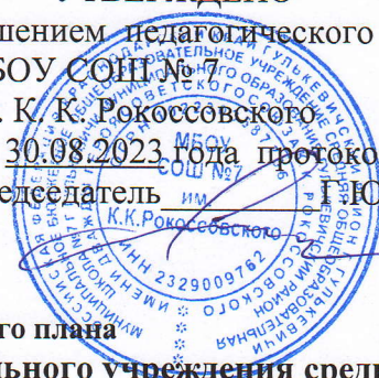
Таблица-сетка часов учебного плана муниципального бюджетного общеобразовательного учреждения средней общеобразовательной школы №7 г. Гулькевичи муниципального образования Гулькевичский район имени дважды героя Советского Союза К.К. Рокоссовского для II классов, реализующего ФГОС НОО- 2021 на 2023 – 2024 учебный год

решением педагогического совета МБОУ СОШ № 7 им. К. К. Рокоссовского от 30.08.2023 года протокол № 1 Председатель ИМ Г. Ю. Кушнарев