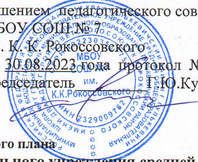
Таблица-сетка часов учебного плана муниципального бюджетного общеобразовательного учреждения средней общеобразовательной школы №7 г. Гулькевичи муниципального образования Гулькевичский район имени дважды героя Советского Союза К.К. Рокоссовского для III классов, реализующего ФГОС НОО на 2023 – 2024 учебный год

решением педагогического совета МБОУ СОШ № 7 им. К. К. Рокоссовского от 30.08.2023 года протокол № 1 Председатель ИМ. К.К.Рокоссовского Т.Ю.Кушнарев