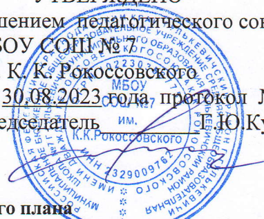
Таблица-сетка часов учебного плана муниципального бюджетного общеобразовательного учреждения средней общеобразовательной школы №7 г. Гулькевичи муниципального образования Гулькевичский район имени дважды героя Советского Союза К.К. Рокоссовского для IV классов, реализующего ФГОС НОО на 2023 – 2024 учебный год